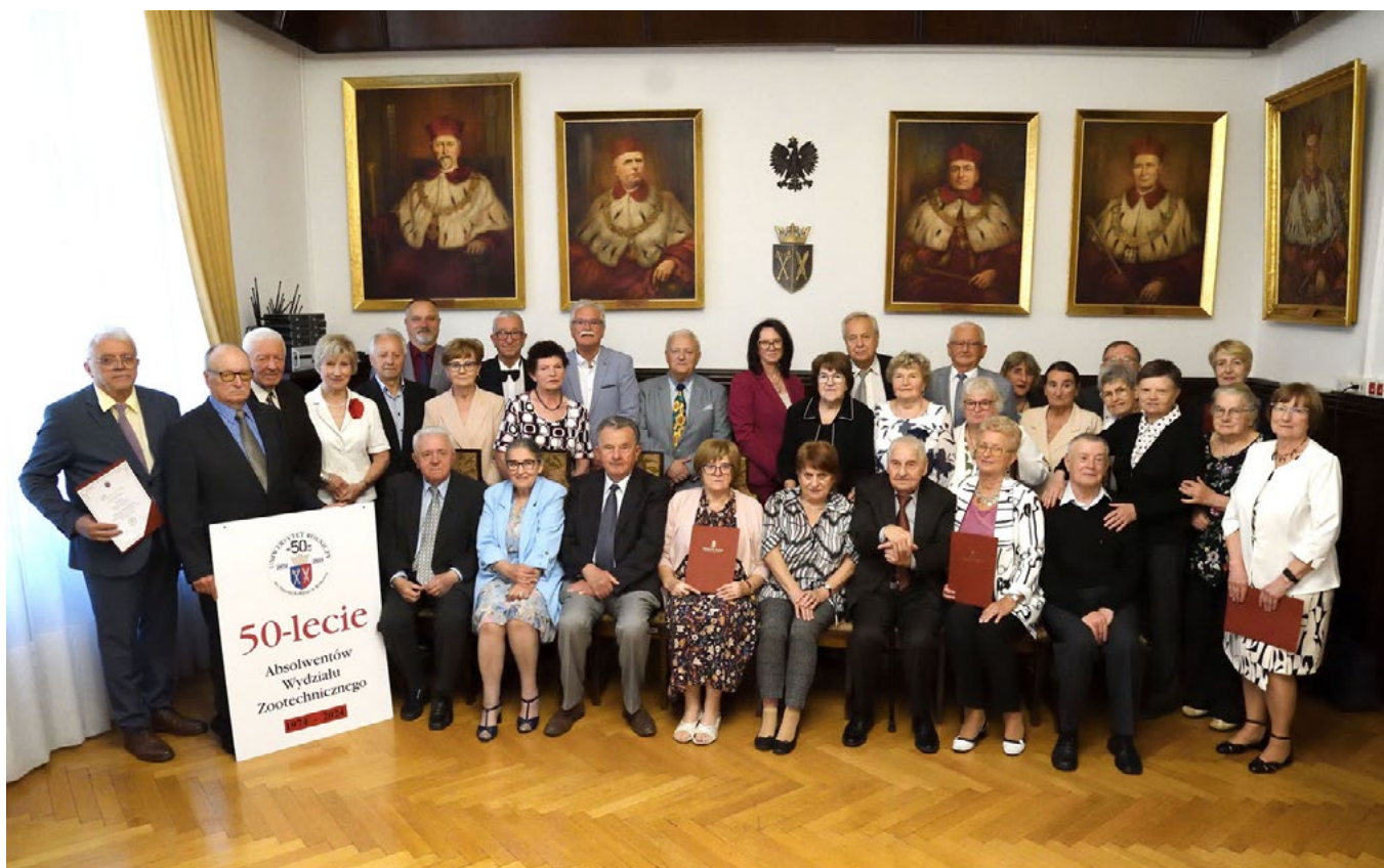
Uczestnicy Jubileuszu 50-lecia ukończenia studiów na Wydziale Zootechnicznym Akademii Rolniczej; fot. Jacek Okarmus