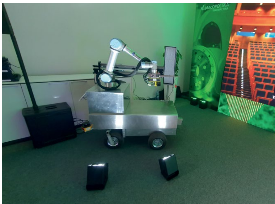
Jagobot – robot do zbioru truskawek