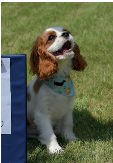
Psięciami został Teo...