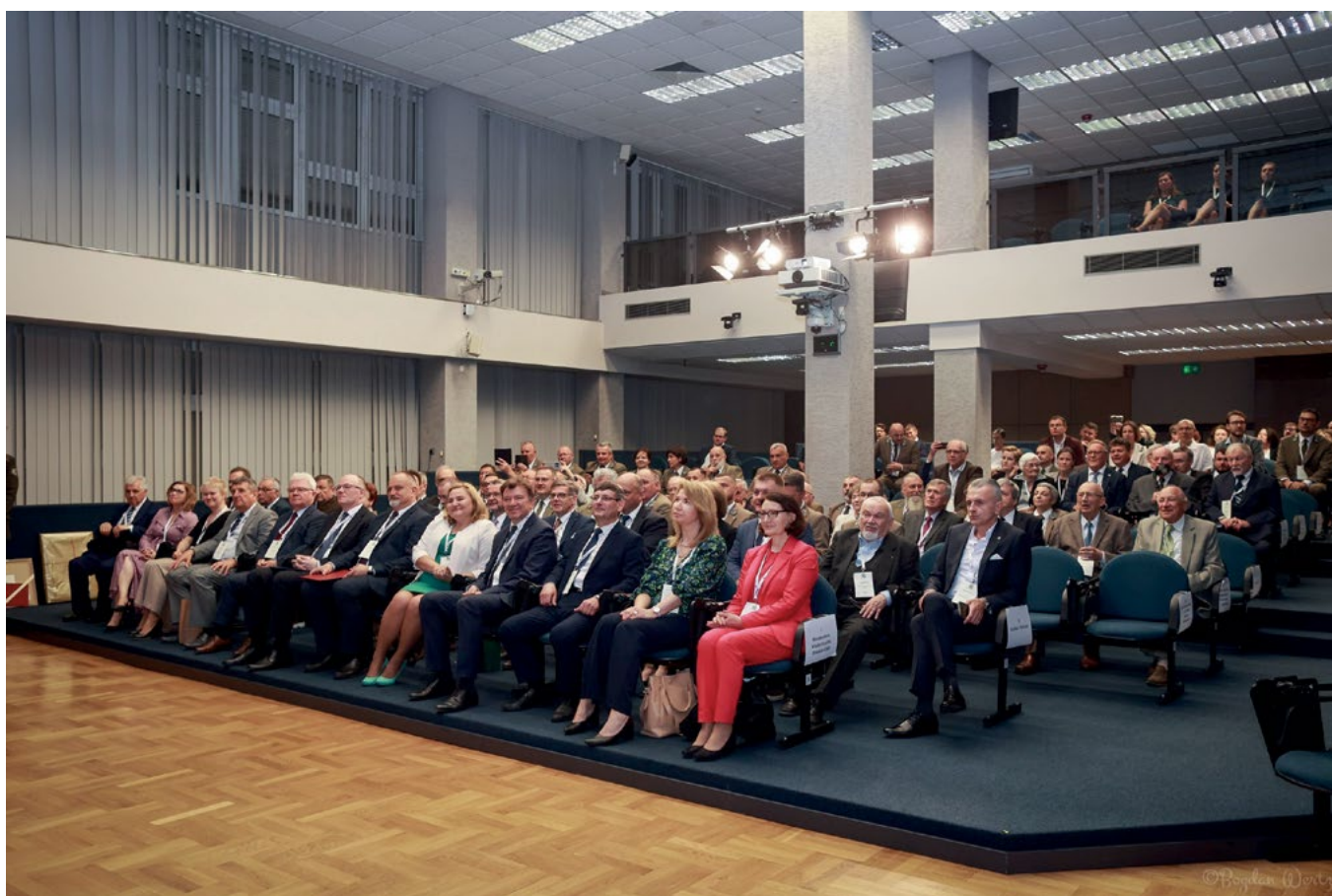
Uczestnicy jubileuszowej konferencji