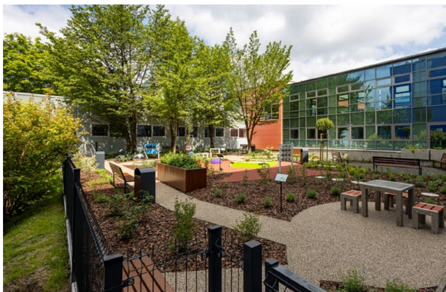
Sensoryczny ogród wyciszeń w Uniwersyteckim Szpitalu Dziecięcym w Krakowie