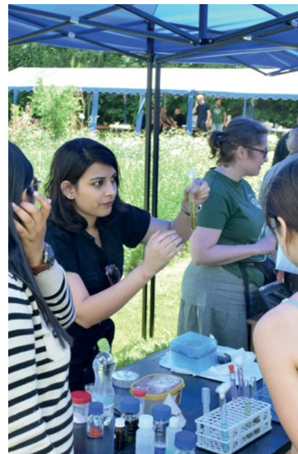
Stoisko Wydziału Rolniczo-Ekonomicznego w Rolniczym Gospodarstwie Doświadczalnym w Prusach