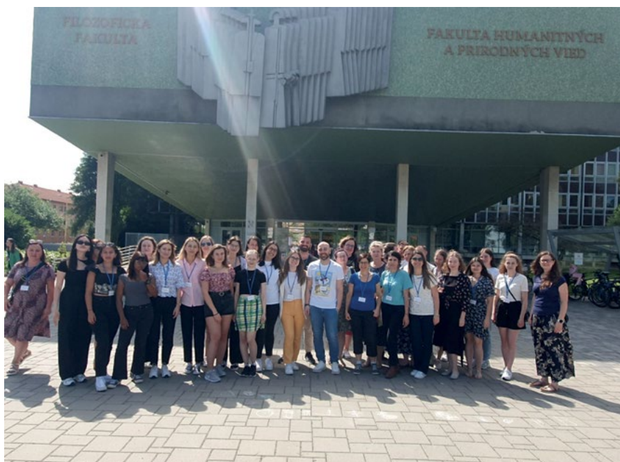
Uczestnicy warsztatów Erasmus+ BIP przed budynkiem Uniwersytetu Preszowskiego

Na trzeci dzień warsztatów zaplanowano szkolenie pszczelarskie oraz wizytę w uniwersyteckim ogrodzie botanicznym, gdzie uprawia się różne odmiany rumianku. Na zakończenie każdy uczestnik otrzymał słoiczek miodu rumiankowego.