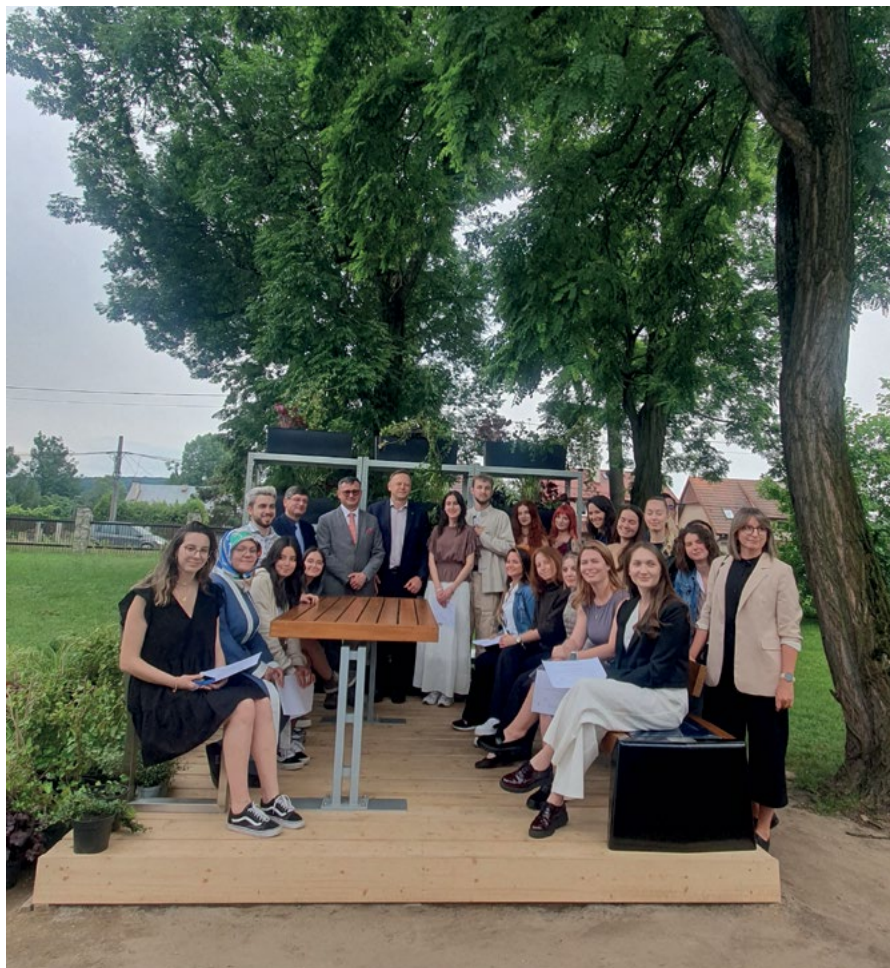
Uczestnicy programu Erasmus-BIP