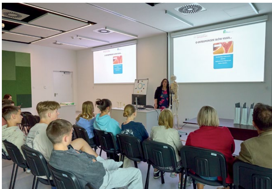
W ramach Dnia Mleka odbyły się prelekcje naukowców URK

Strefa wystawiennicza cieszyła się również dużym zainteresowaniem. Odwiedzający mogli zapoznać się z najnowszymi