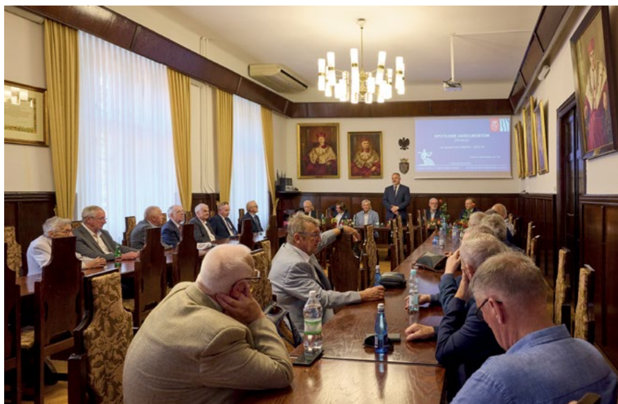
Absolwenci Wydziału Melioracji Wodnych AR w sali Senackiej Collegium Godlewskiego

Obchody Jubileuszu rozpoczęliśmy Mszą Świętą w Bazylice Mariackiej w Krakowie. Uroczystości kontynuowa-