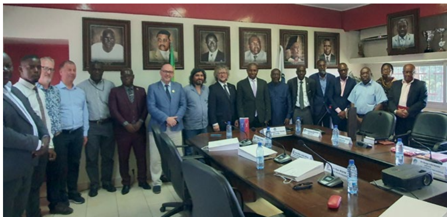
Spotkanie z władzami Uniwersytetu Omar-Bongo

• zastosowań technologii geoinformacyjnych w badaniach środowiskowych dla studentów laboratorium LANASPET (Laboratoire d'Analyse Spatiale et des Environments Tropicaux) – dr hab. inż.