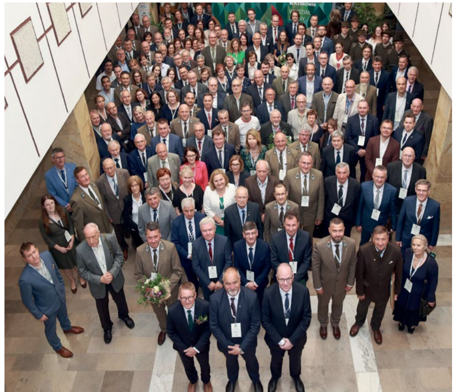
Uczestnicy Jubileuszu 75-lecia Wydziału Leśnego