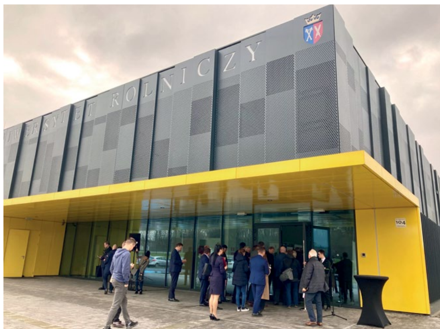
Centrum Innowacji oraz Badań Prozdrowotnej i Bezpiecznej Żywności

mików sprawiła, że w ciągu 50 lat działalności Oddziału i Wydziału Technologii Żywności opublikowaliśmy ok. 3000 oryginalnych prac twórczych, ok. 900 prac popularnonaukowych oraz kilkadziesiąt podręczników i skryptów. Zorganizowaliśmy 84 konferencje i sympozja naukowe, zrealizowaliśmy ponad 120 projektów badawczych finansowanych z różnych źródeł, w tym z funduszy krajowych (KBN, MEiN, MNiSW, NCN, NDBiR, ARiMR i in.) lub Unii Europejskiej, zrealizowaliśmy kilkadziesiąt innych zadań w ramach m.in. działalności statutowej i badań młodych.