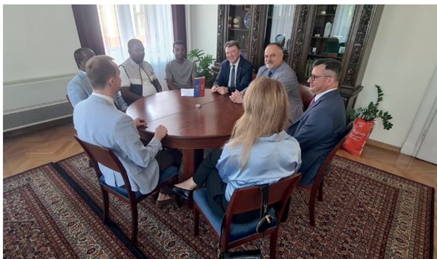
Spotkanie w gabinecie rektora URK