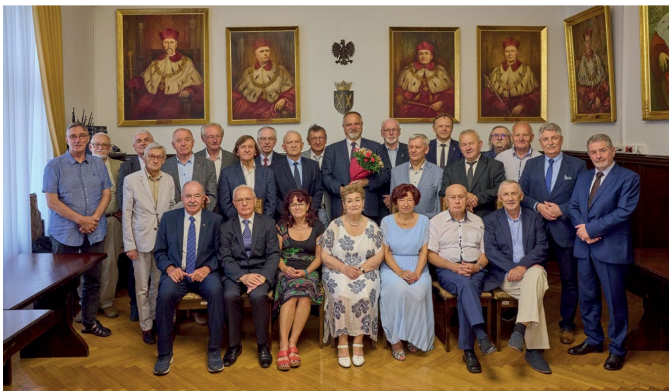
Uczestnicy Jubileuszu 50-lecia ukończenia studiów na Wydziale Melioracji Wodnych z Oddziałem Geodezji Urzędzeń Rolnych AR; fot. Piotr Dul