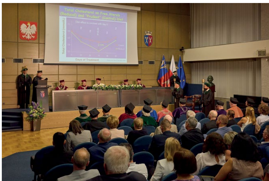
Doktor honoris causa URK wygłasza wykład

Profesor aktywnie uczestniczy w życiu naukowym, m.in. poprzez przynależność do licznych stowarzyszeń, instytucji czy organizacji naukowych, takich jak: International Advisory Board for the International Society of Nutraceuticals and Functional Foods, Institute of Food Science and Technology, Chińska Akademia Nauk Rolniczych (jako international supervisor ), Institute of Food Science and Technology (jako academic consultant ), Executive Committee for British Columbia Institute of Food Technologists, Canadian BioFutures Leader Forum, Industrial Discussion Panel for the Functional Foods and Natural Health Products Canadian Western Industry Cluster led by NRC/IRA-