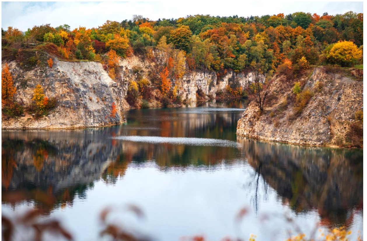
Zalew Zakrzówek