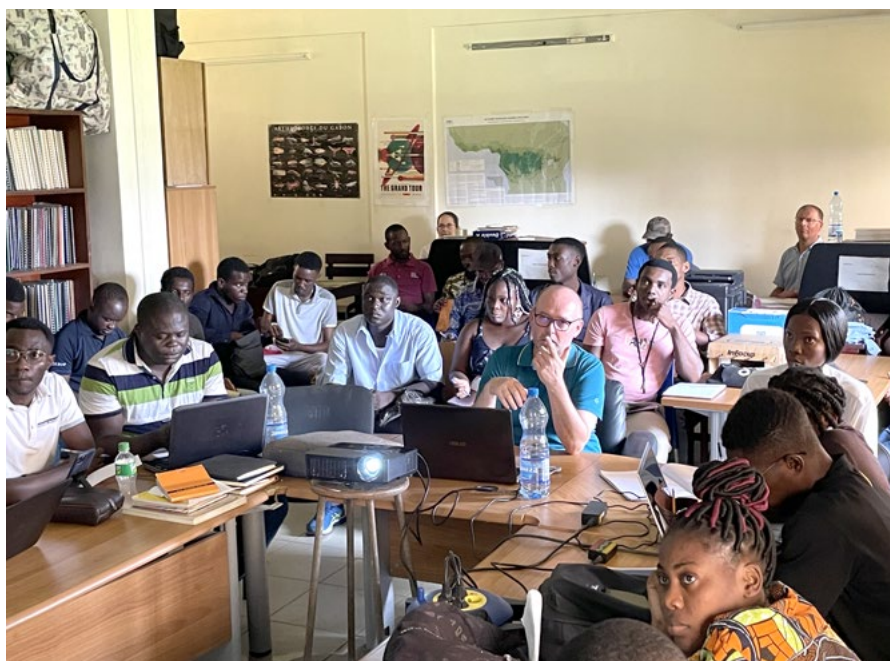
Wykład z technologii geoinformatycznych

Tekst i zdjęcia: uczestnicy misji CEBOT- URK