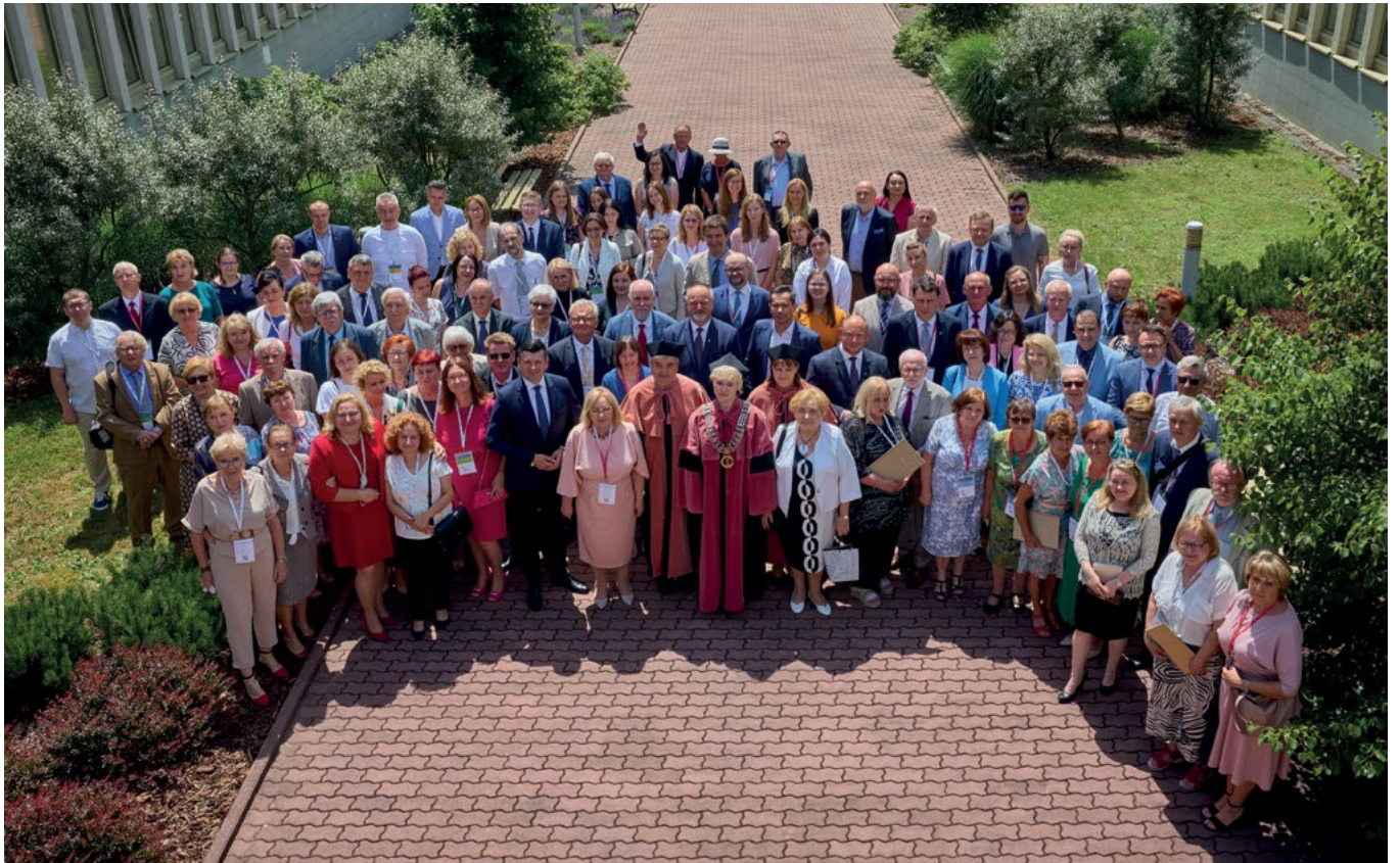
Pamiątkowe zdjęcie uczestników Jubileuszu 50-lecia Wydziału Technologii Żywności