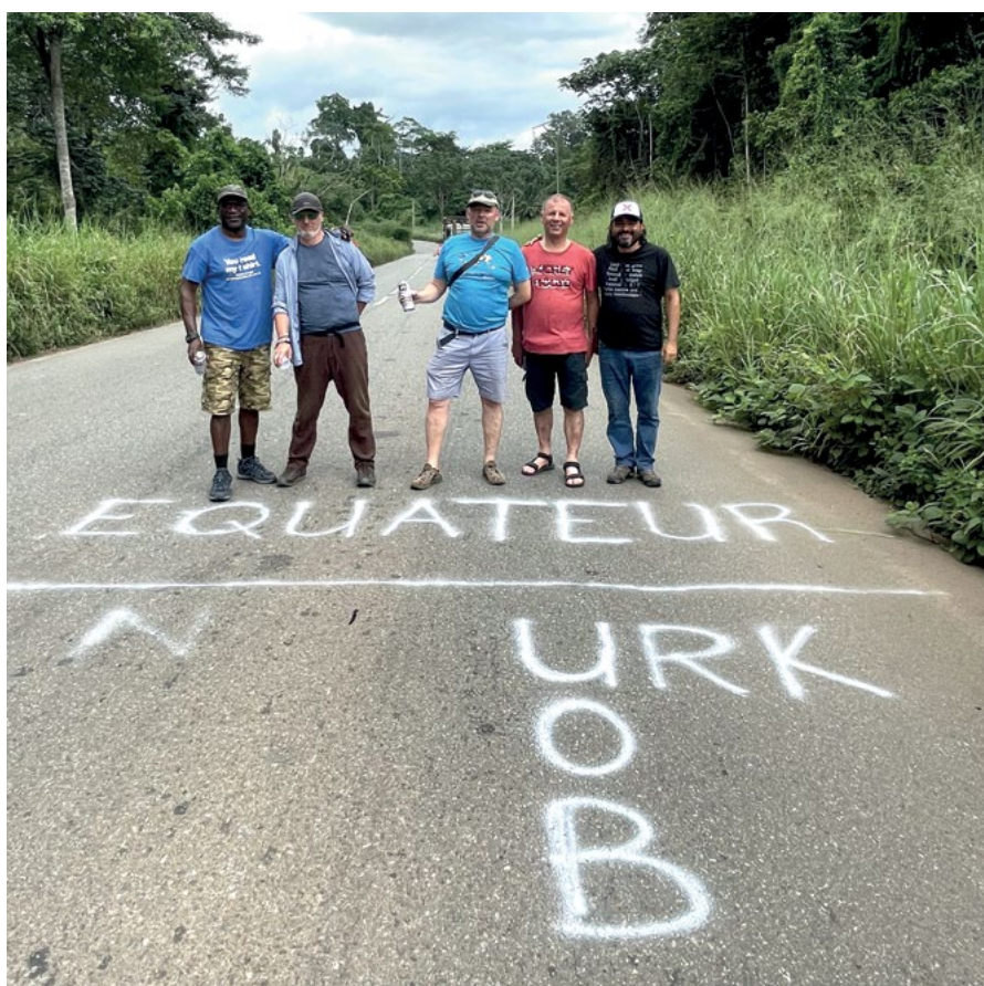
Wyznaczenie położenia równika na drodze N1