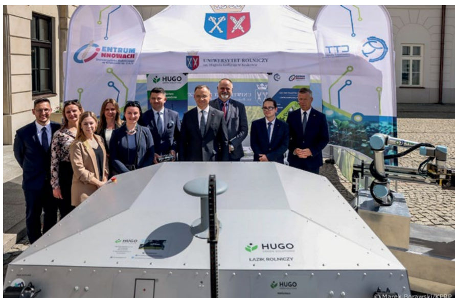
Delegacja URK z prezydentem Andrzejem Dudą