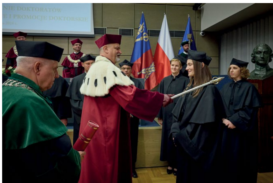
Rektor uroczystie promuje doktorów habilitowanych