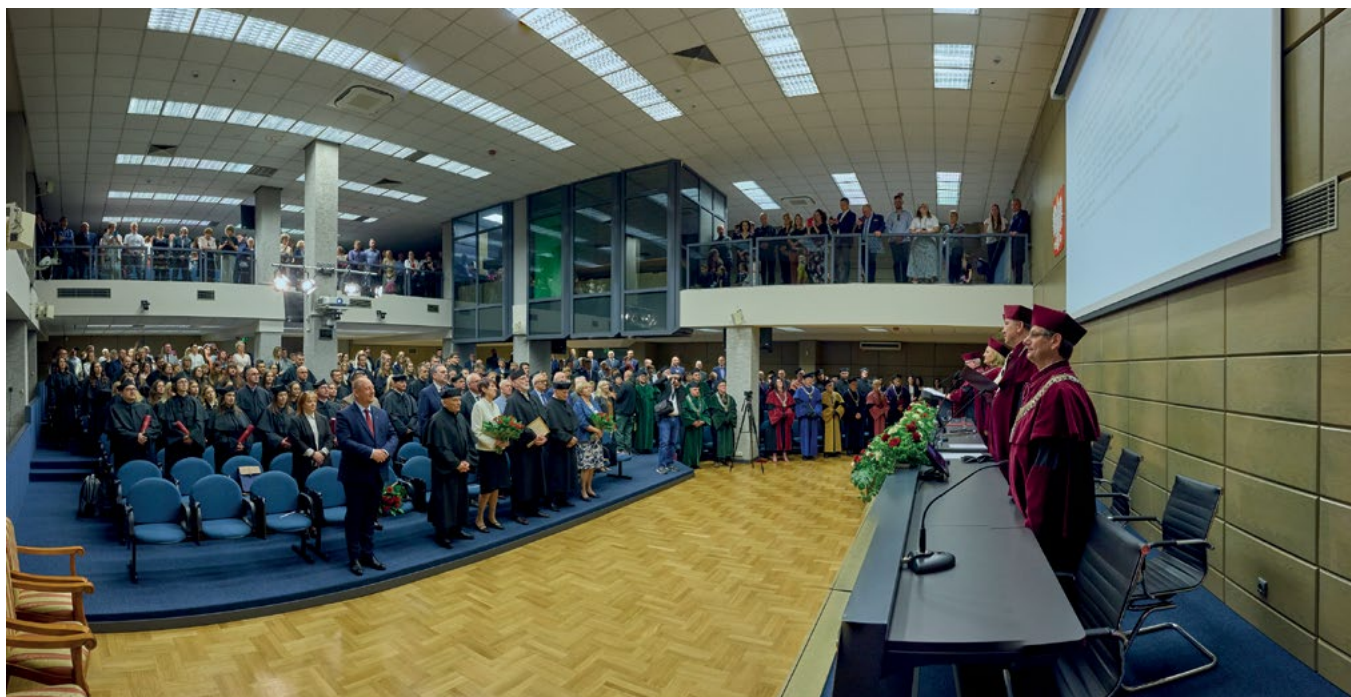
Centrum Kongresowe URK: uroczystość promocji habilitacyjnych i doktorskich oraz odnowienia doktoratów

17 maja 2024 r. w auli Centrum Kongresowego URK przy al. 29 Listopada 46 w Krakowie odbyła się uroczystość odnowienia doktoratów oraz promocji habilitacyjnych i promocji doktorskich. Wręczone zostały także medale państwowe za długoletnią służbę oraz Medale Komisji Edukacji Narodowej.