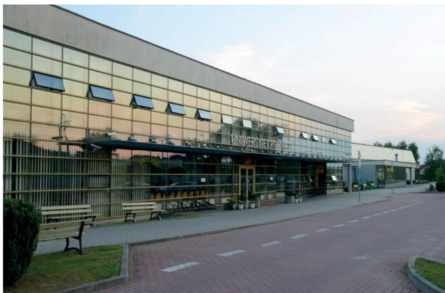
Budynek Wydziału Technologii Żywności przy ul. Balickiej w Krakowie