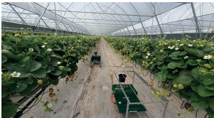
Nowoczesna szklarnia tunelowa firmy Amplus