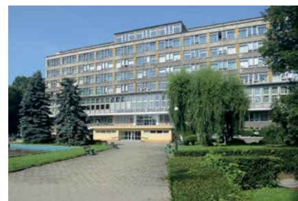
Budynek Jubileuszowy URK