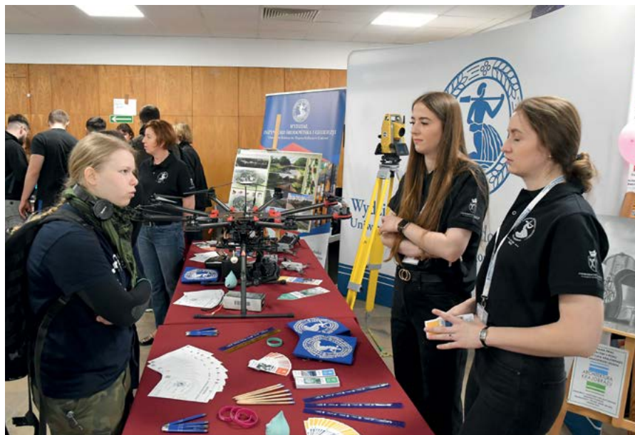
Stoisko Wydziału Inżynierii Środowiska i Geodezji