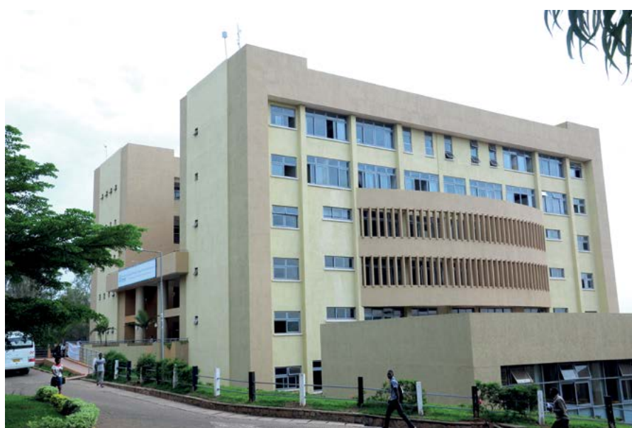
Kampus Gikondo w Kigali – siedziba Uniwersytetu Rwandy; fot. Hirwa94 (CC BY-SA 4.0, https://commons.wikimedia.org/w/index.php?curid=82203962 )