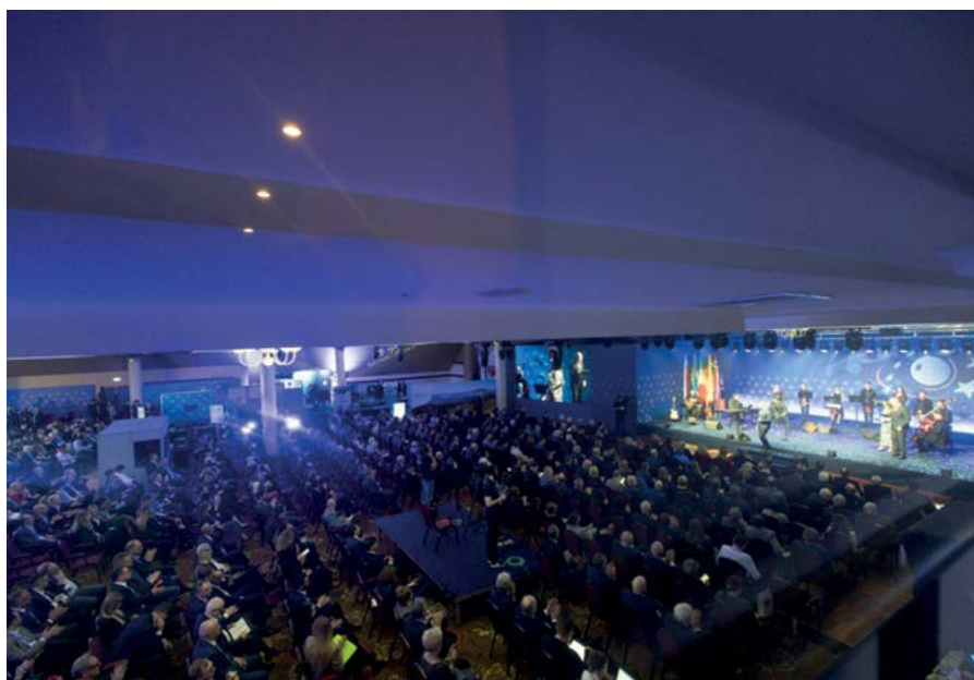
Każdy dzień obrad w Hotelu Gołębiewski kończył się uroczystą galą