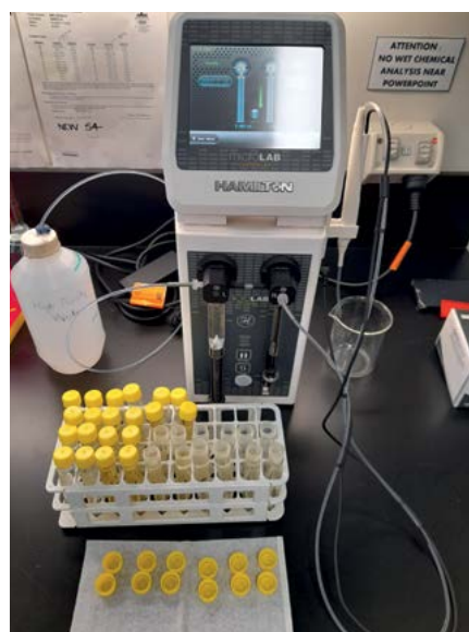
Badania i sprzęt wykorzystany w laboratoriach Uniwersytetu Sydney