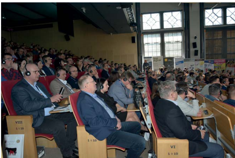
Konferencja cieszyła się sporym powodzeniem, wzięło w niej udział 388 uczestników pochodzących z 18 krajów

Po ostatnim wykładzie i dyskusji dokonano krótkiego podsumowania konferencji, a także zaproszono wszystkich uczestników na przyszły rok. Z niecier-