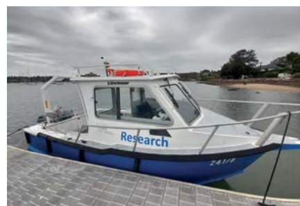
Pobór osadów dennych, Sydney Harbour