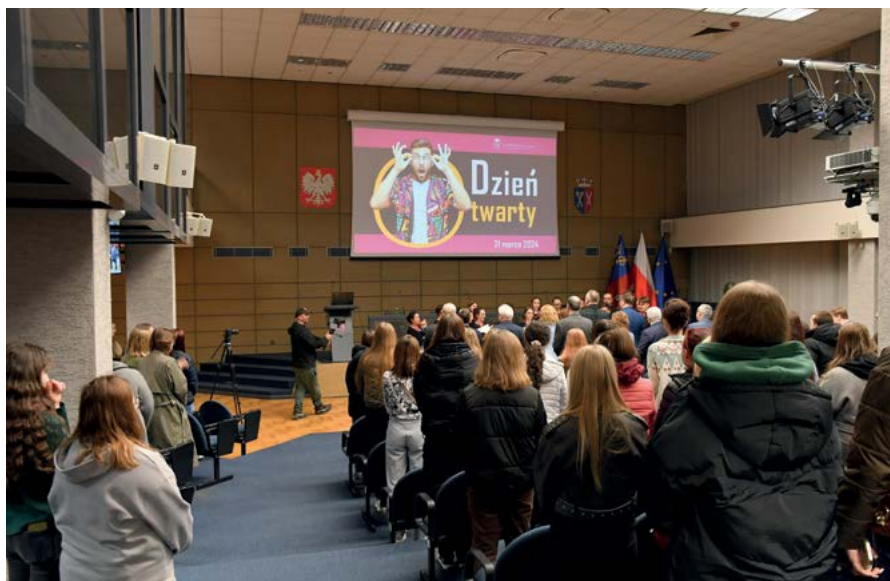
Dzień Otwarty Uniwersytetu Rolniczego uroczyste rozpoczęło się w auli Centrum Kongresowego URK

Nie zabrakło również atrakcji a wśród nich znalazły się m.in. videobudka 360