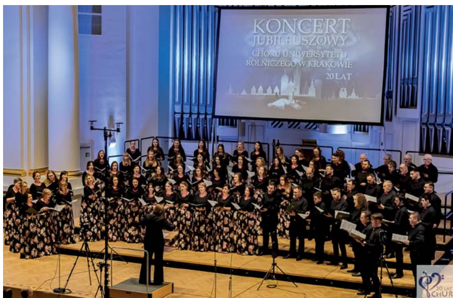
Koncert jubileuszowy Chóru URK odbył się w Filharmonii Krakowskiej; fot. Ada & Sobiśław Pawlikowscy Photography

Chór Uniwersytetu Rolniczego w Krakowie powstał w grudniu 2003 r., przy ówczesnej Akademii Rolniczej w Krakowie.