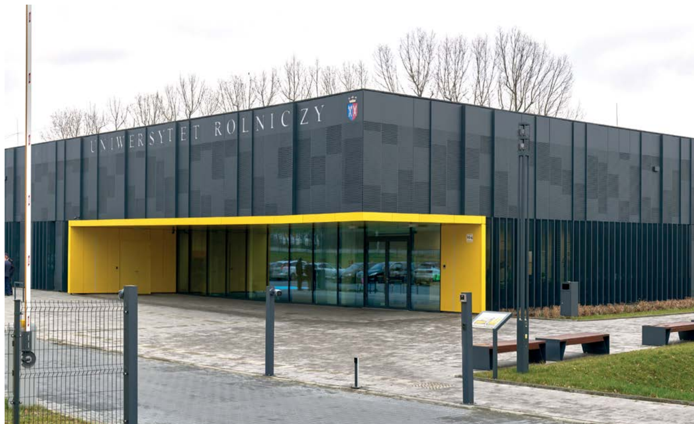
Centrum Innowacji oraz Badań Prozdrowotnej i Bezpiecznej Żywności – widok od ulicy Balickiej